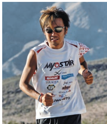
2011 BADWATER ultramarathon 5位